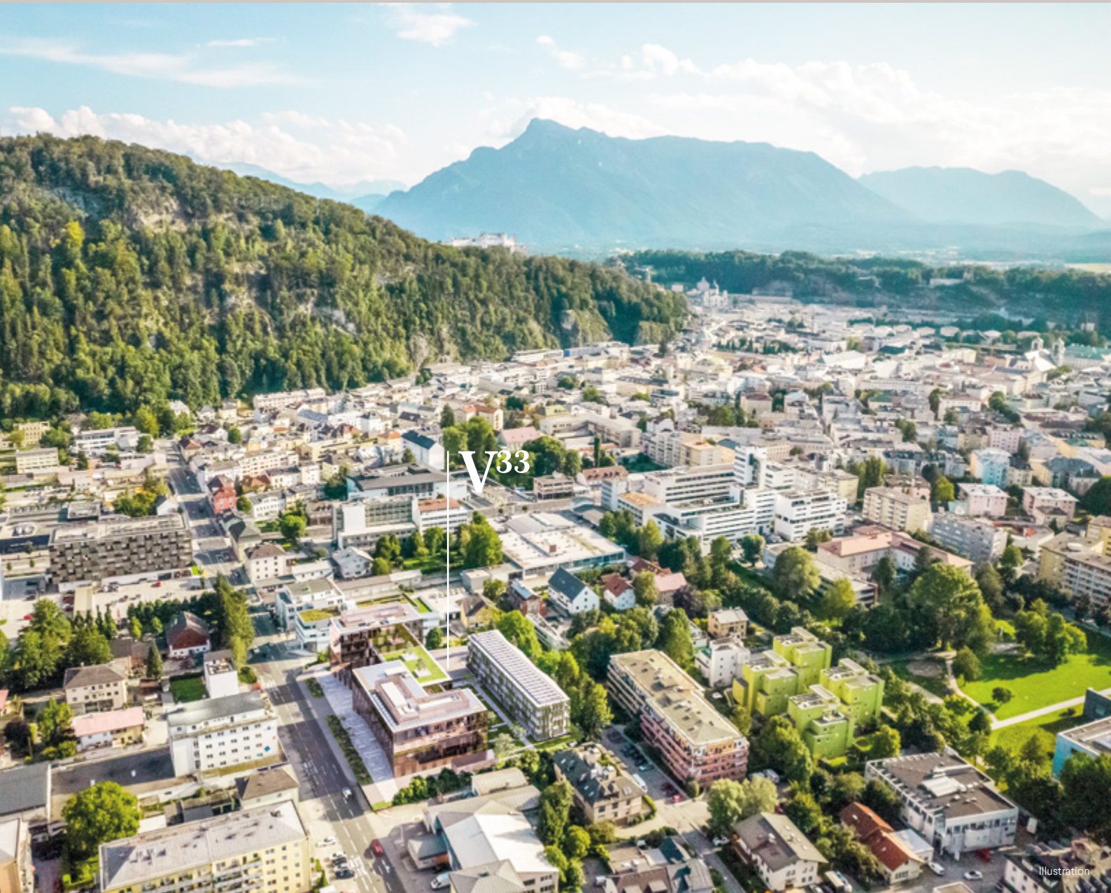
V33 im Überblick